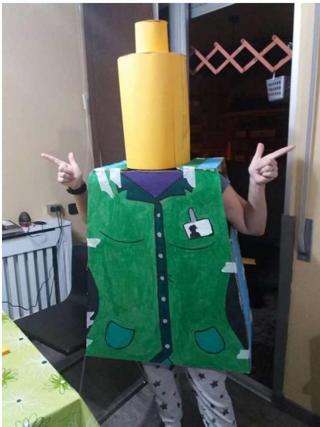
La LEGO Veterinaria