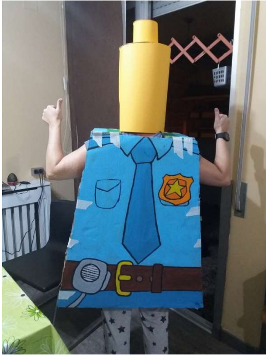
La o él LEGO policia.